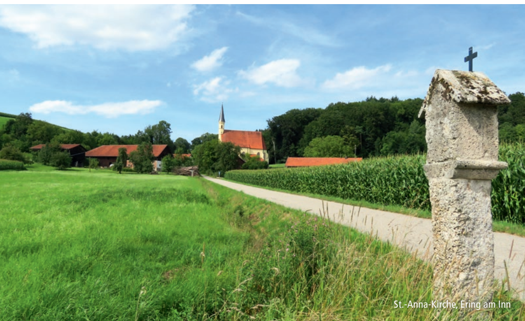
St.-Anna-Kirche, Ering am Inn

Unsere diesjährige Via Nova Pilgerwanderung führt uns von Haarbach im niederbayerischen Klosterwinkel durchs schöne Rottal. Mit meditativen Impulsen machen wir uns auf den Weg über Parzham, Bad Griesbach bis Ering am Inn und befinden uns damit auch auf den Spuren des hl. Bruder Konrads. In den nächsten Jahren setzen wir den Weg fort bis St. Wolfgang im österreichischen Salzkammergut.