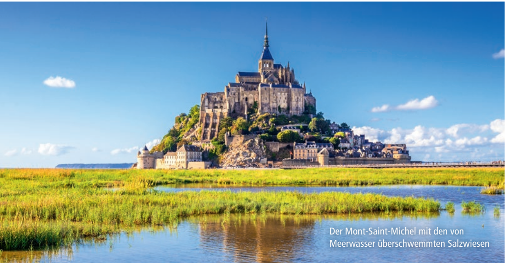
Der Mont-Saint-Michel mit den von Meerwasser überschwemmten Salzwiesen