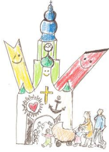
Familien und Kinder Im PV Burghausen