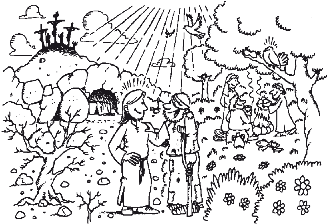
Quelle: www.familien234.de - Ausmalbild zum Sonntag nach Pfingsten, Lesjahr A, Joh 3, 16 - 18