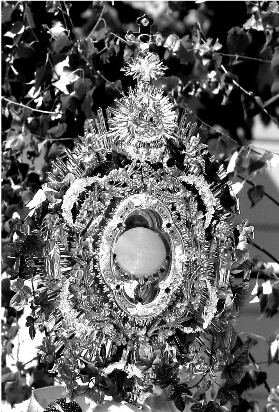
Monstranz mit dem Allerheiligsten